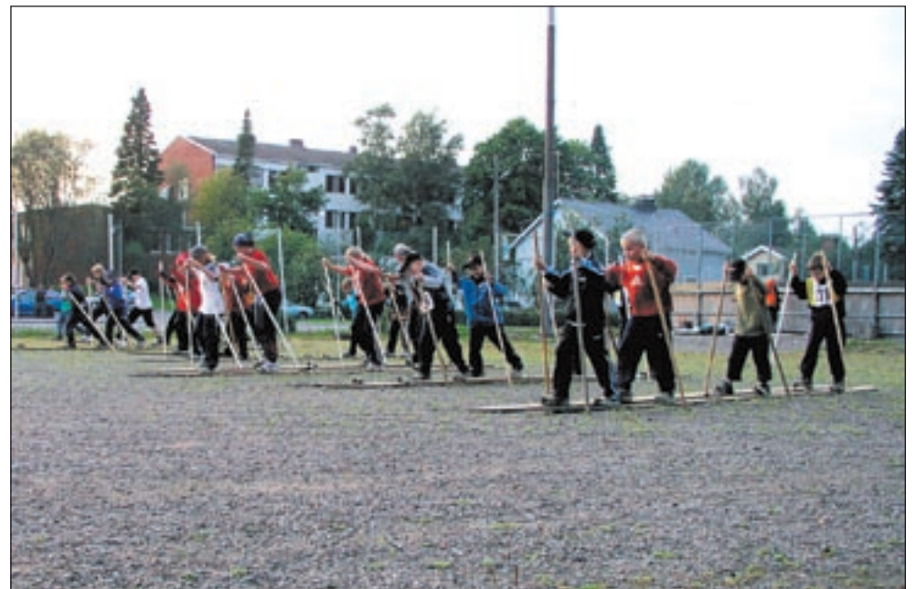
Joukkue hiittää ryhmäsuksilla kilpaa. Ei ollut aivan helppoa.