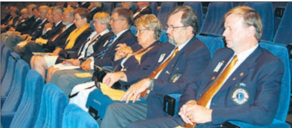
Kuvernöörit puolisoineen eturivissä.