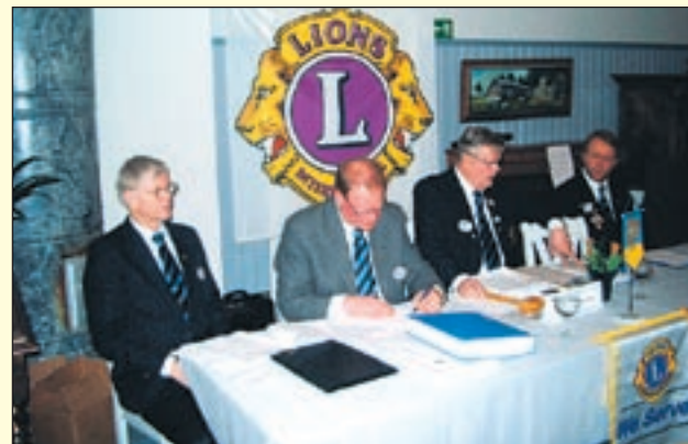
Piirihallitus aloittelemassa kokousta Kiukaisissa.