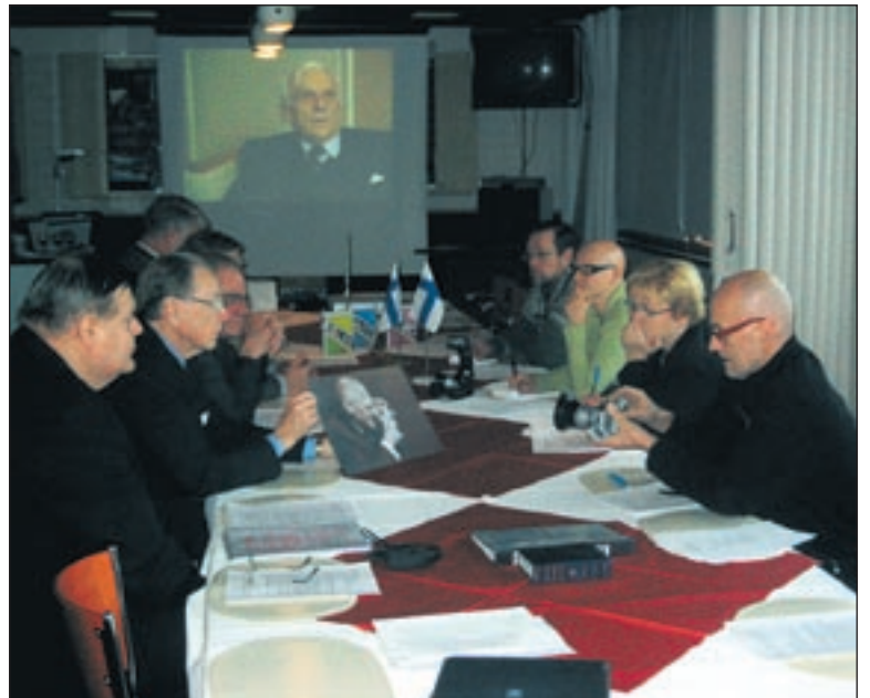
Lehdistö kiinnitti projektiin suurta huomiota sen valmistuttua. Kuva on Huittisten Seurahuoneella pidetystä lehdistötilaisuudesta.