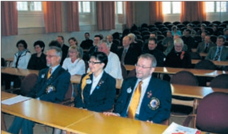
Läsnä ollut leijona-väki viihtyi tilaisuudessa. (kuva)