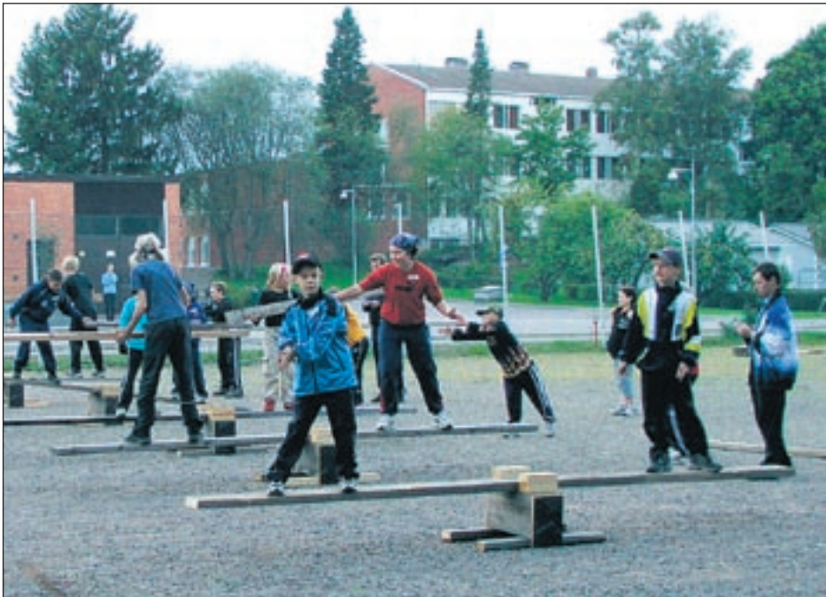
Ryhmät siirtävät "lankkusiltaa-keinoa" pitkin lankkuja yli niin, ettei leinu osu maahan. Ehdottomasti vaikein laji taidollisesti.