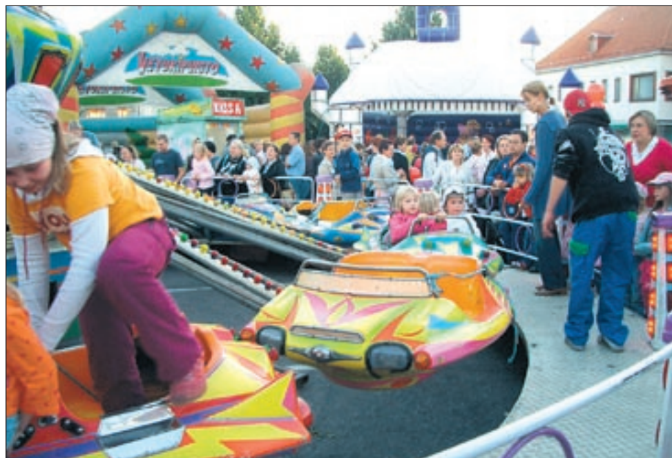
Myös lapsille ja nuorille löytyy ohjelmaa Hörhiäisten aikaan.