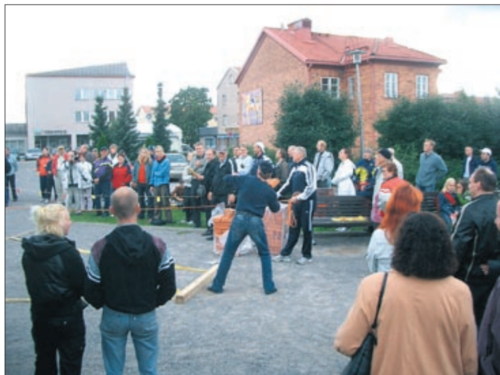
Tiilentyönnön SM-kisa käynnissä.