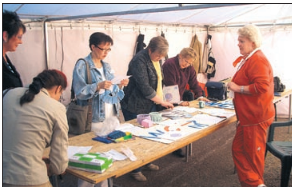
Ladyt "räknäämässä" arpajaismyyntin tuottoa.