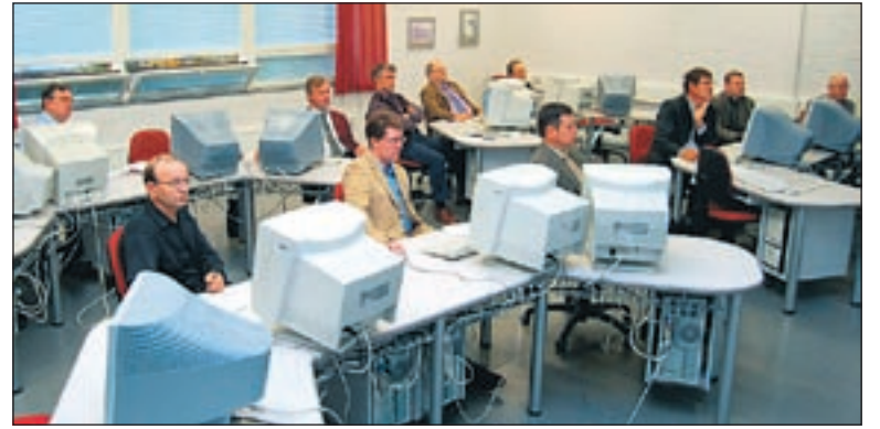
Syksyllä PNAT-kokousten yhteydessä sihteerit tutustuivat mm. uuteen kansainväliseen jäsenrekisteriin (kuva)

riin. Rekisterien päivitykset hoitaa yleensä klubin sihteeri. Klubit voisivat tulevaisuudessa harkita myös sellaista vaihtoehtoa, että klubiin nimittäisiin rekisterienhoitaja, joka toimisi esim. kolmevuotiskauden. Näin toimien jokaisen sihteerin ei tarvitsisi opetella rekisterien päivitystä, varsinkin kun kauden aikana saattaa päivitettävää olla suhteellisen vähän.