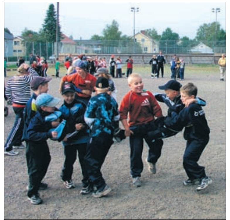
Ryhmä koettelee kuntoaan kantamalla yhtä jäsentään kerrallaan. Kilpailijoiden kasvot olivat tämän lajin jälkeen melko punaiset.

Tänä vuonna järjestimme myös rahakeräyksen riehan rinnakkaistapahtumaksi. Lahjoittaja sai vastikkeeksi nimeään näkyville mainoksissa ja lehti-ilmoittelussa. Saimme pikkusummilla kokoon noin 800 euroa ja lahjoitimme rahat Mannerheimin Lastensuojeluliiton Kokemäen osastolle.