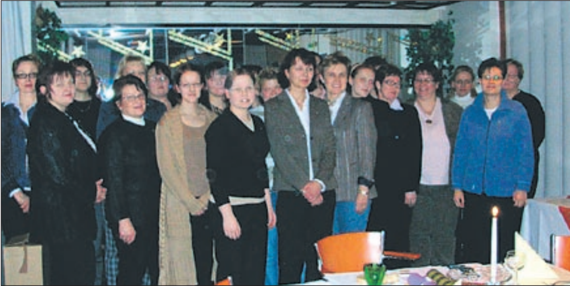
Klubin perustajajäsenet antoivat lionslupauksen ensimmäisessä varsinaisessa klubikokouksessaan 3.1.2006.

Itsenäisyyspäivän jälkeisenä päivänä, 7.12.2005 tehtiin Huittisten seudulla lionshistoriaa. Piiriimme perustettiin uusi klubi, LC Huittinen/Gerda. Perustamiskokouksessa klubiin liittyi 24 jäsentä, jotka kaikki ovat naisia. Perustajajäsenet ovat kotoisin Huittisista, Punkalaitumelta, Säkyylästä ja Vampulasta. Tammi-kuun klubikokouksessa tehtiin vielä päätös kahden lisäjäseneen kutsumisesta. Myös heidät järjestöimme tulee katsomaan perustajajäseniksi, koska he ovat liittyneet klubiin ennen perustamiskirjan luovutusta, joka tapahtuu 11.3.-06. Perustettu klubi on piirissämme 61. varsinaisen lionsklubi. Lisäksi piirissä toimii yksi liittäjäklubi.