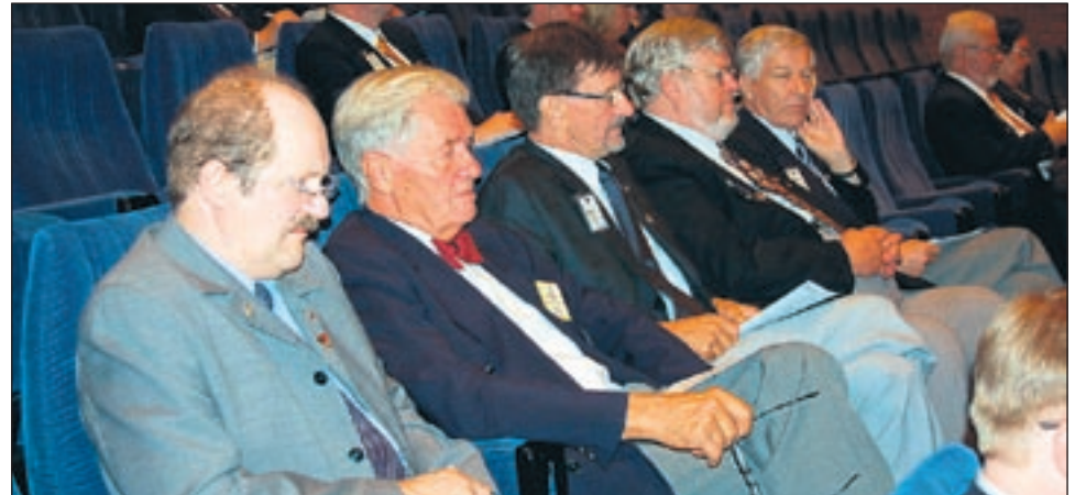
Piirin tarkkaavaisia kokousedustajia.