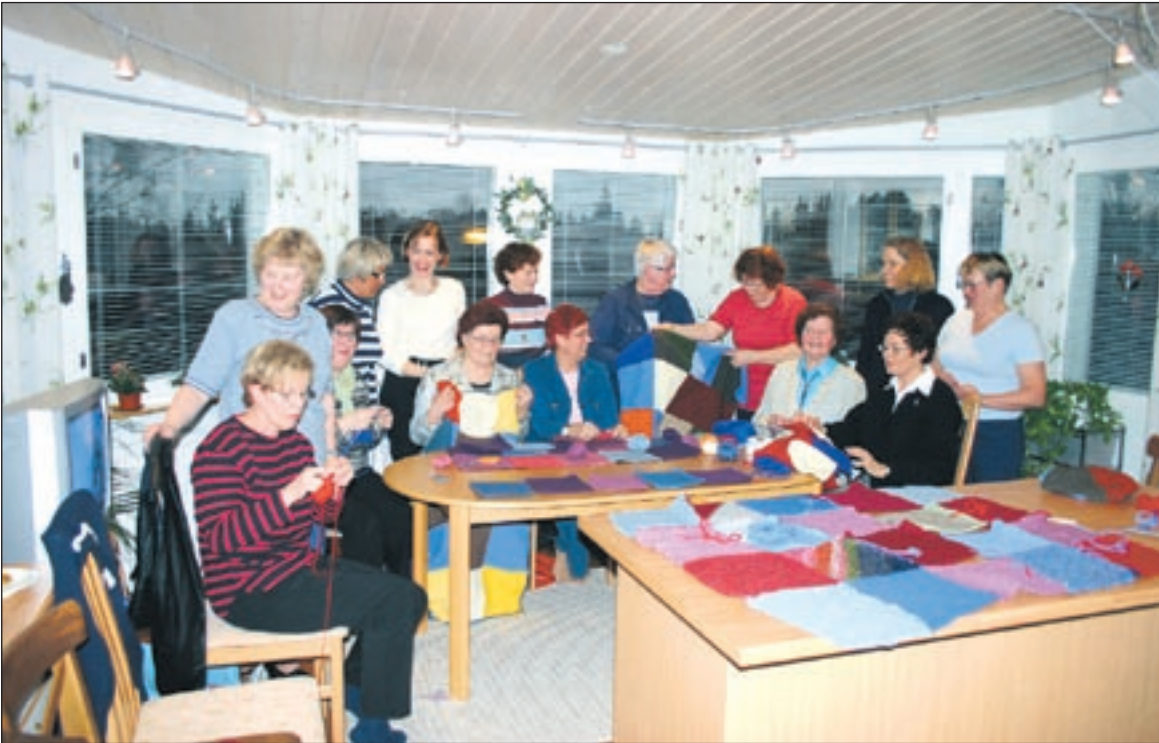
Huhtikuun 2005 ladyillassa valmiista tilkuista kasattiin iloisenkirjavia tilkkupeittoja lähetettäväksi vastasyntyneiden lämmikkeeksi Pristinaan, Kosovoon.