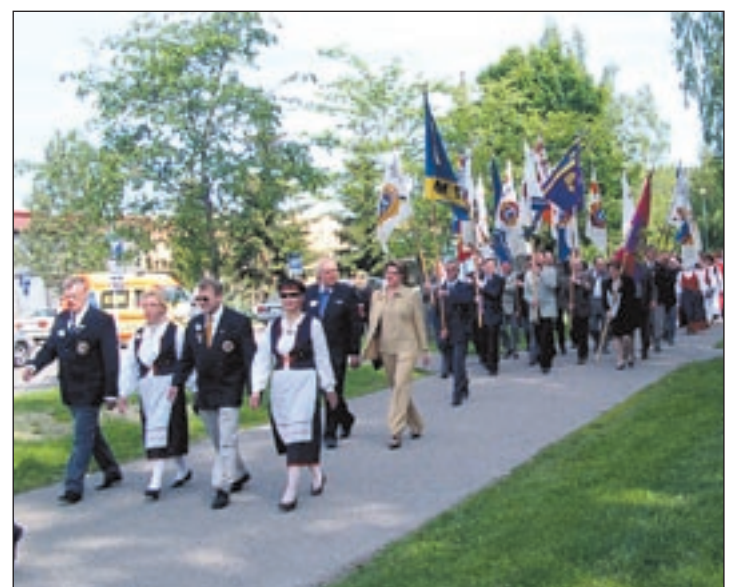
107M-piiriläisiä Kuopion vuosikokouksen marssilla.